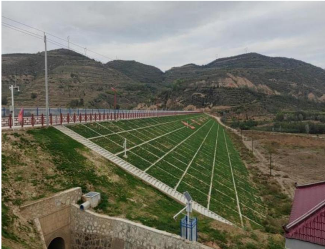
图 4-1 格草皮护坡