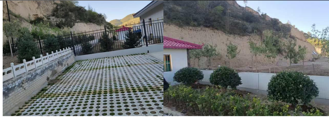
管理区植被恢复情况