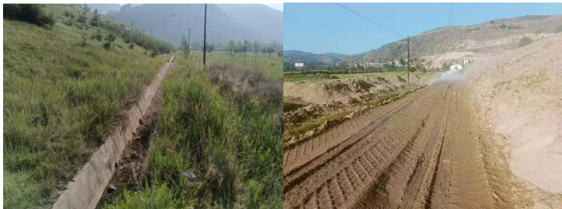
填沟造地区域恢复情况