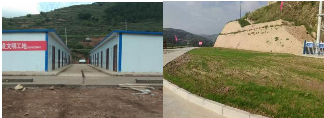
施工生产生活区施工前后对比

本项目设有临时用地，用于机械停放，物料堆放及施工营地布置。施工结束后对临时用地进行松土、平整，恢复，经现场勘查，治理效果较好。